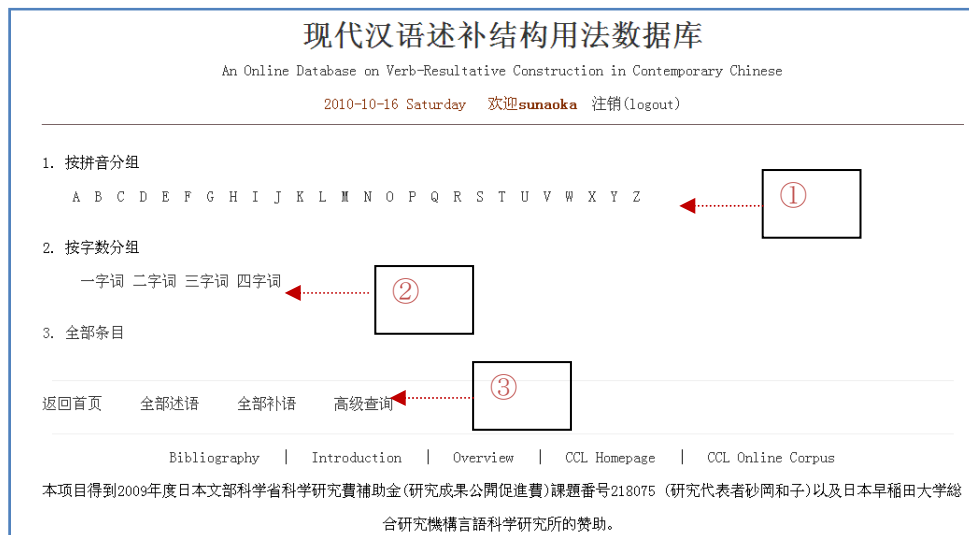
[图 2] 单纯检索